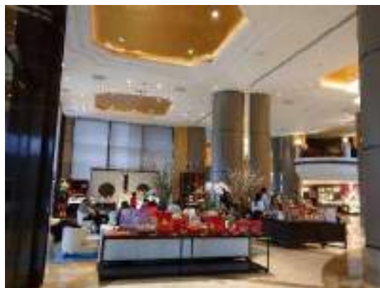
春節前で華やかな雰囲気のホテルロビー