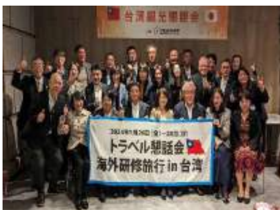
台湾へたくさん送客するぞ！