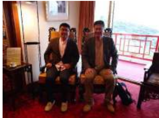
蒋介石と夫人の椅子に座り