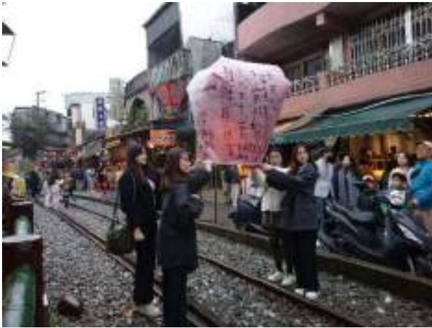
天燈上げをするするアジアからの観光客