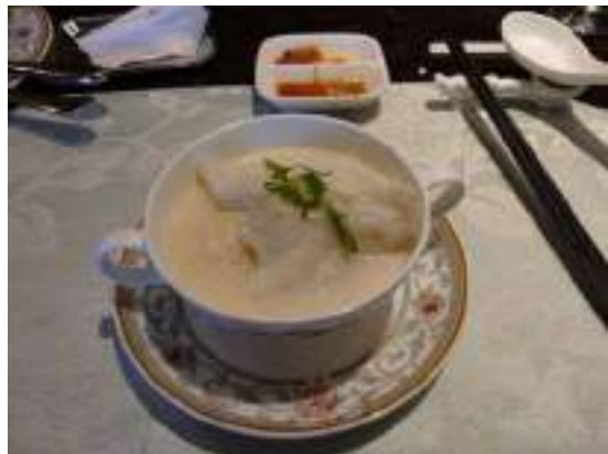
ハタそうめんスープ 絶品！

どの料理もとても上品で美味しく線切り豆腐（菊の花の形）スープではシェフが実演。豆腐を包丁ひとつで細く線切りをしながら菊の花の形に仕上げていきます。どれも美味しい料理でしたが、個人的には魚湯龍斑麺線（ハタそうめんスープ）絶品でした。