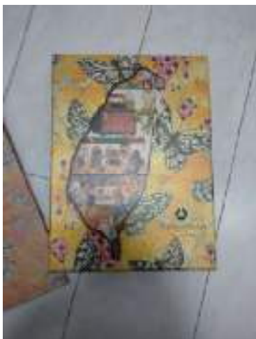
お土産のパイナップルケーキ

手配を下さった阪急交通社様、現地の金品旅行社様、行事研修委員会の皆様に改めてお礼を申し上げます。ありがとうございました。