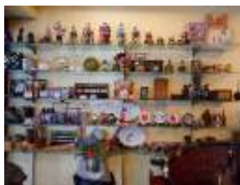
レトロな雰囲気の内