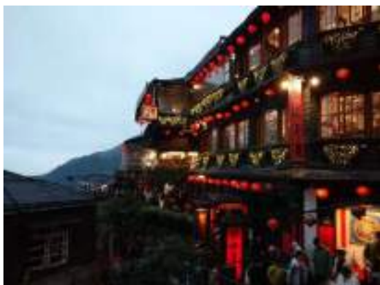
有名な九份の風景

九份は主にアジアからの観光客で大賑わい路地を歩きながら散策をしてお土産の購入や写真撮影など思い思いに時間を過ごします日が沈み、夜が更けてくると幻想的な風景に九戸茶話で台湾郷土料理をいただきます。