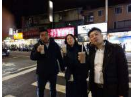
タピオカ飲みながらご機嫌♪