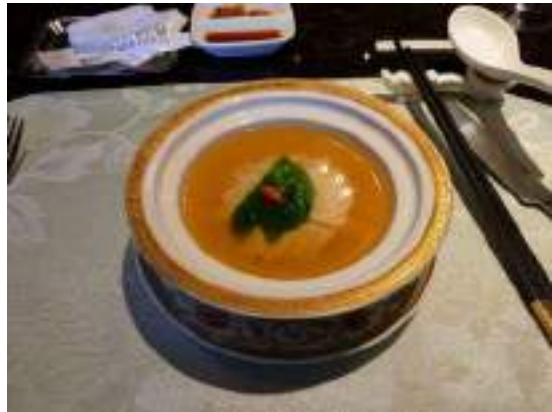
線切り豆腐（菊の花の形）のスープ