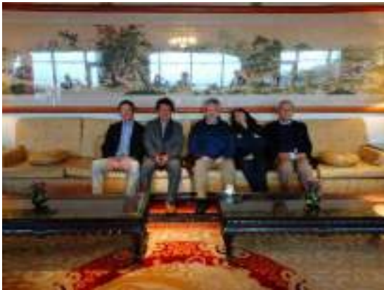
こんなに広い待合室でお茶を飲みながら