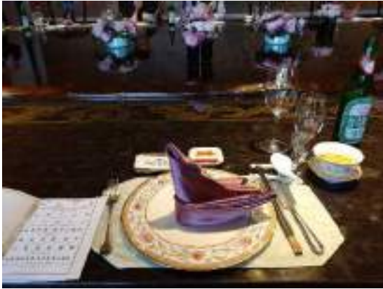
豪華な食事の開始