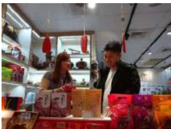
からすみの値段交渉中