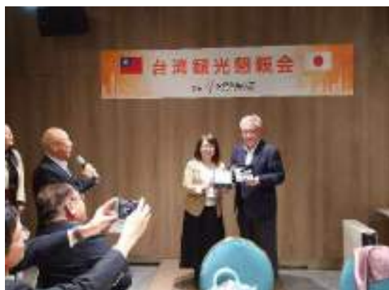
副部長に日本からのお土産を渡します

各テーブルには台湾交通部観光課の職員が同席し日台交流の促進について意見を交わします。台湾インバウンドの来年度の目標は昨年度の倍の 1200 万人ということで日本から多くの観光客が戻ってくることを期待されていました。