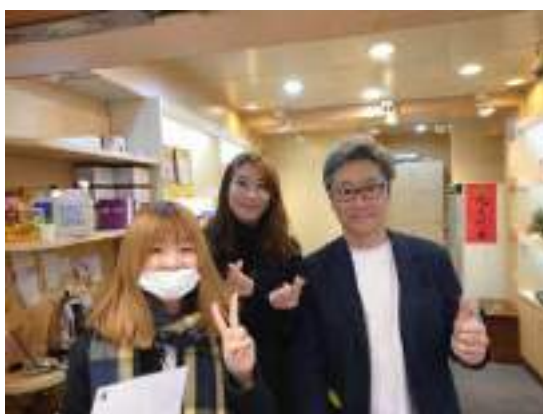
阿里山茶と烏龍茶を買って記念撮影