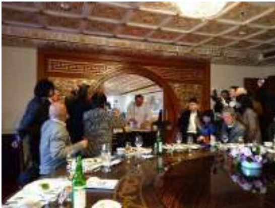
シェフによる線切り豆腐の実演