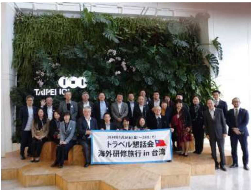
台北 101 職員の皆様と一緒に記念撮影。 職員の皆様は私たちのバスが出発するまでずっと手を振って見送ってくれています。 職員の皆様が微笑ましく、なんだかとても感動をしました。