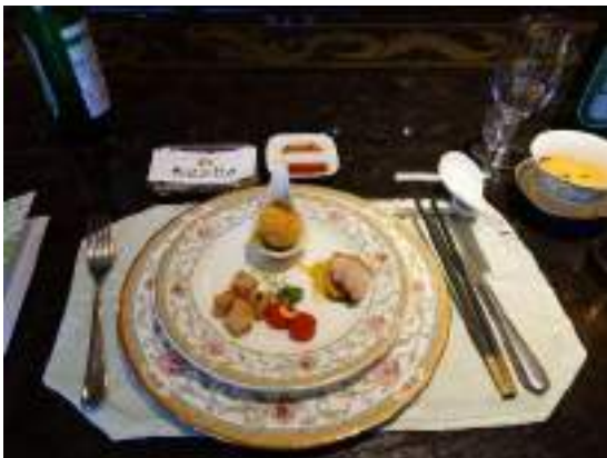
前菜の盛り合わせ